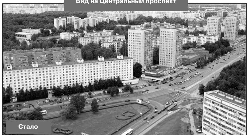
Вид на Центральный проспект