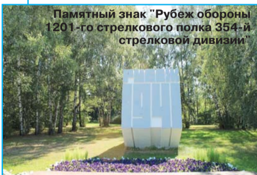
Памятный знак "Рубеж обороны 1201-го стрелкового полка 354-й стрелковой дивизии"

В границах района Матушкино расположены 10 памятников и памятных знаков в честь де-