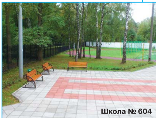
Школа № 604

В рамках благоустройства территорий в дошкольных образовательных учреждениях № 322, 524, 2096, 455 проводились ремонтные работы.