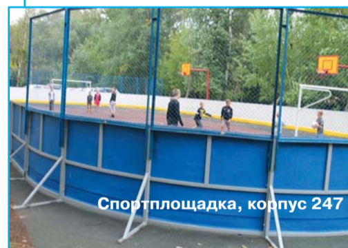
Спортплощадка, корпус 247

В зимний период 2012-2013 г. управой района Матушкино на площади Юности планируется обустроить ледяную горку, а также 3 катка у корпусов 109, 165 "Б", 403.