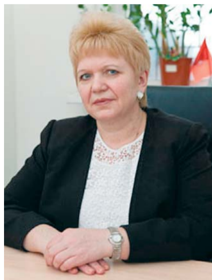
Ежегодно в марте свой профессиональный праздник отмечают работники торговли, бытового обслуживания населения и