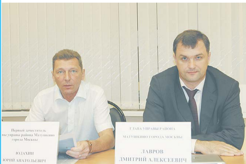
Первый заместитель управы района Матушкино города Москвы ЮДАХИН ЮРИЙ АНАТОЛЬЕВИЧ