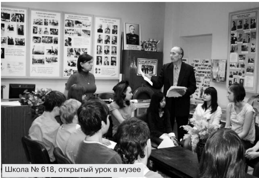
Школа № 618, открытый урок в музее